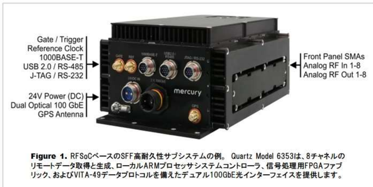
Figure 1. RFSocベースのSFF高耐久性サブシステムの例。Quartz Model 6353は、8チャンネルのリモートデータ取得と生成、ローカルARMプロセッサシステムコントローラ、信号処理用FPGAファブリック、およびVITA-49データプロトコルを備えたデュアル100GbE光インターフェイスを提供します。

アプリケーションに応じて、追加のフロントエンド処理タスクには、ターゲットの追跡と識別、変調/復調、または暗号化/復号化が含まれます。これらの処理は、低遅延のパフォーマンスを提供するだけでなくバックエンド処理タスクの負荷を大幅に軽減します。SFFエンクロージャー内の高感度RF回路とデータコンバータにより、メインシステムへのリンクがデジタル化されアナログRFケーブルが不要になります。