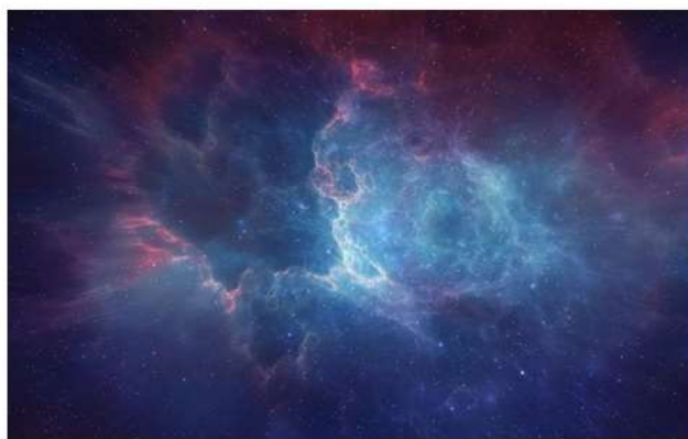
新しい分光計は、星の間の星間物質の研究において大きな前進となります

https://pubs.rsc.org/en/content/getauthorversionpdf/c8cp02055h