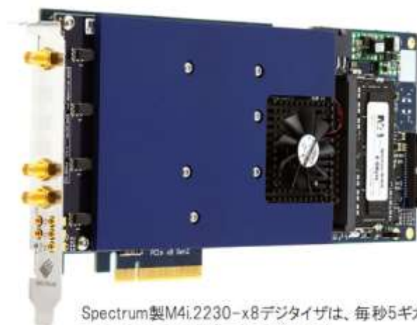
Spectrum製M4i.2230-x8デジタイザは、毎秒5ギガサンプルのアナログ信号を取得します

「サンプルチャンバーを冷却するための新しい設計により、通常的设计よりもはるかに高いサンプリングレートを実現し、広い帯域幅でサンプリングを行うことが必要です。したがって、広い帯域幅で大量のデータを迅速にキャプチャする手段が必要でした。カリフォルニア大学デイビス校の同僚の何人かは、Spectrum 製のデジタイザボードを推奨しました。M4i.2230-x8 を選択したのは、大容量のオンボードメモリ、最大 1.5 GHz の帯域幅、および非常に高速な平均化機能を備えているためです。他社のカードを調べましたが、高価であるか仕様を満たしていませんでした。さらに、私たちが検討した他のソフトウェアとは異なり、ソフトウェアとの統合が非常に簡単でデータ取得プロセスを完全に自動化することができました。」