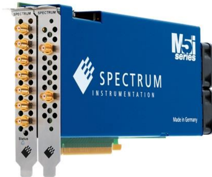
Figure 2 : M5i.3321-x16デジタイザボードは、2つのチャネルのそれぞれで3.2GS/sのサンプリング速度、12bitの分解能、および1GHzの帯域幅を提供します。M5i.33xxファミリには、10GS/sの最高速度と3GHz以上の最高帯域幅を備えた5つの異なるモデルがあります。

Vind-Vind社は2つの姉妹会社で構成されています。PJ Science ApS社は革新的なLIDARシステムの製造と販売に注力しており、Vind-Vind ApS社は建設業界向けの風力解析を行うコンサルティング会社です。より詳しい情報はこちらをご確認ください： www.vindvind.com